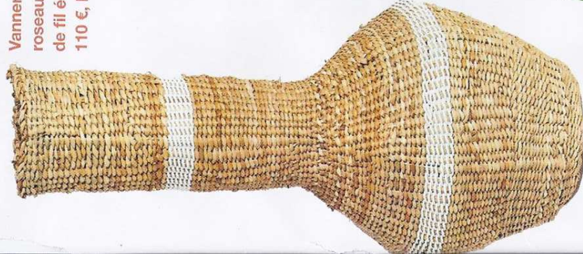
Vanneries en roseau et récup' de fil électrique. 110 €, Mahatsara.