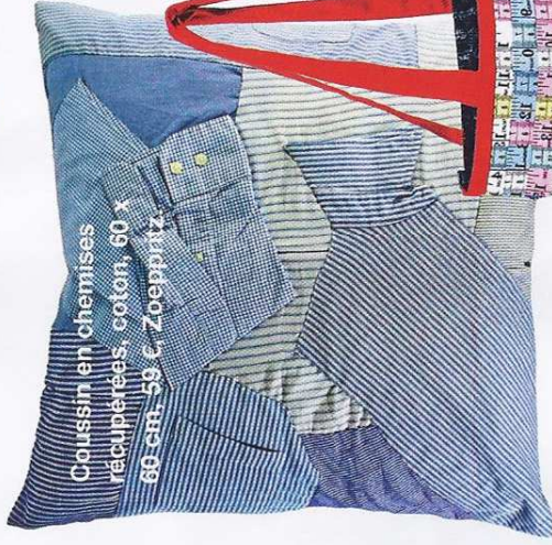
Coussin en chemises récupérées, coton, 60 x 60 cm. 58 €, Zoepprätz.