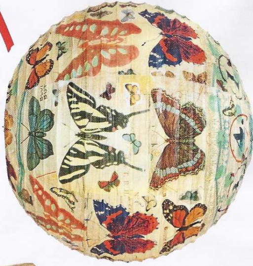
En papier recyclé, suspension faite main, ø 35 cm, 13 €, Pep up design.