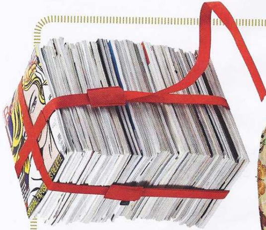
Sangle pour utiliser des vieux magazines en tabouret, Arik Levy, 28 €, Eno sur Homology.