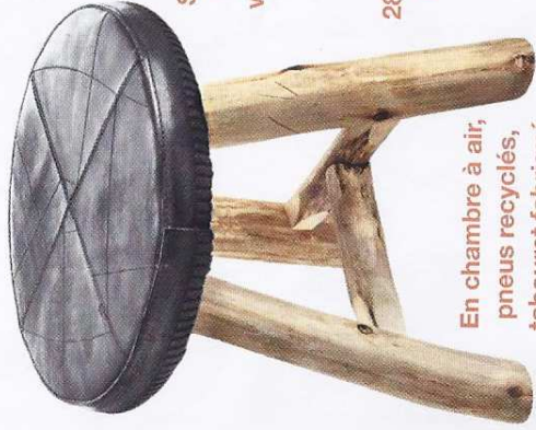
En chambre à air, pneus recyclés, tabouret fabriqué par une ONG en Inde, 119 €, Marron Rouge.