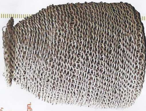
Panier 100 % papier recyclé, H 60 cm x ø 42 cm, fait main au macramé, 415 € env., Best Before.