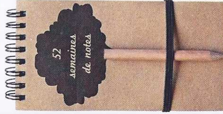
52 semaines de notes